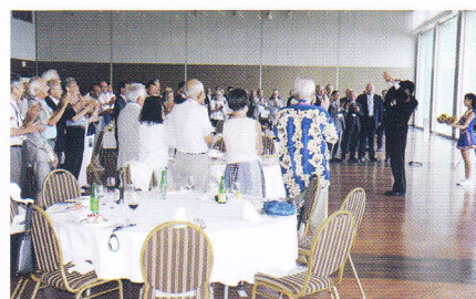
美味しいお食事を楽しみながら懇親を深め、皆で100周年を祝いました