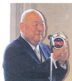
【懇親会】記念品の目覚まし時計のお披露目