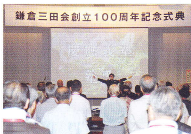
【記念式典】 塾歌斉唱