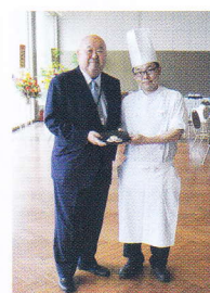
デザートテーブルにはお祝いに特別の慶應ロゴマーク